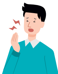
口腔内や舌の痛み

口腔内や舌の痛み、白い苔のようなものが付着したり、味覚異常などの症状があらわれることがあります。そのほか、右ページのイラストのように口腔内や舌、口の両端などに見た目の変化が起こることがあります。