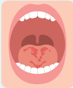
赤いカンジダ症 (紅斑性カンジダ症)