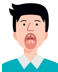
口腔内や舌に白い苔 のようなものが付着