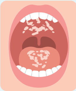
白いカンジダ症 (偽膜性カンジダ症)